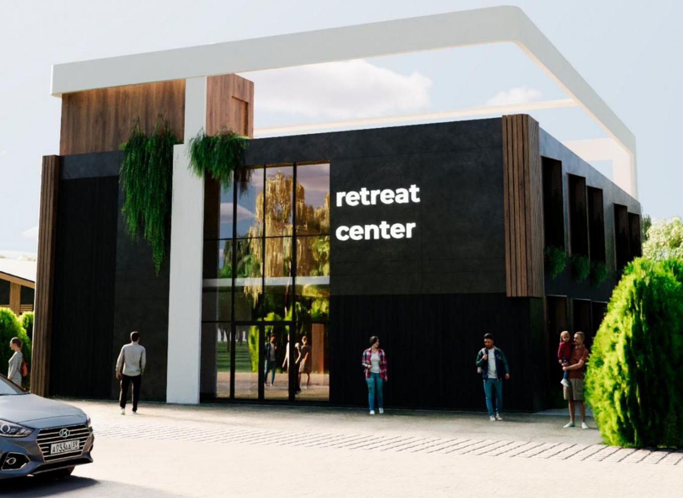
Тип объекта: коттедж Этажей: 1