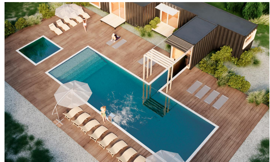
Общая площадь: 86 м 2 Название коттеджного посёлка: Грин Лаундж. Ретрит квартал