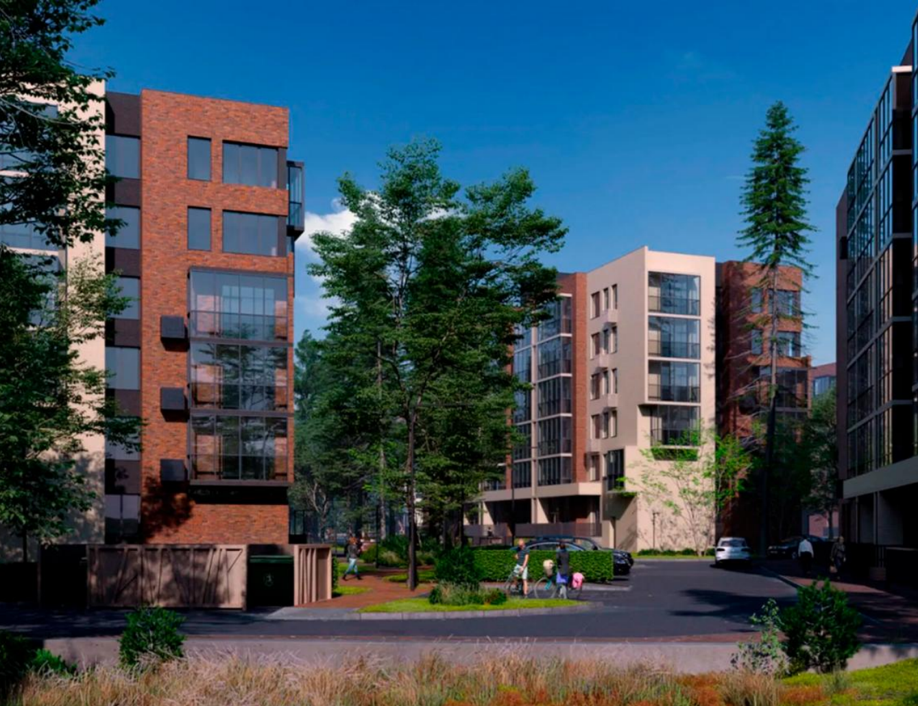
Название ЖК: Лесная Отрада Класс жилья: Комфорт