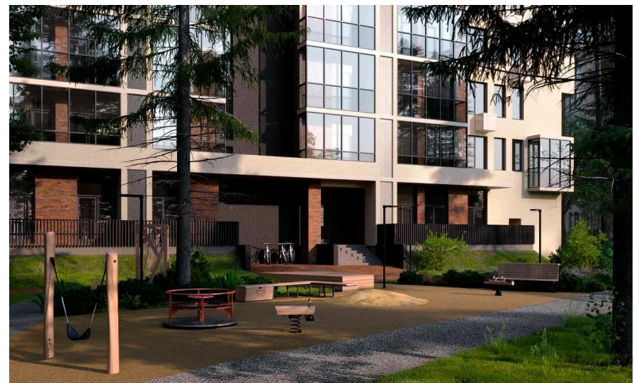
Год постройки: 2026 г.