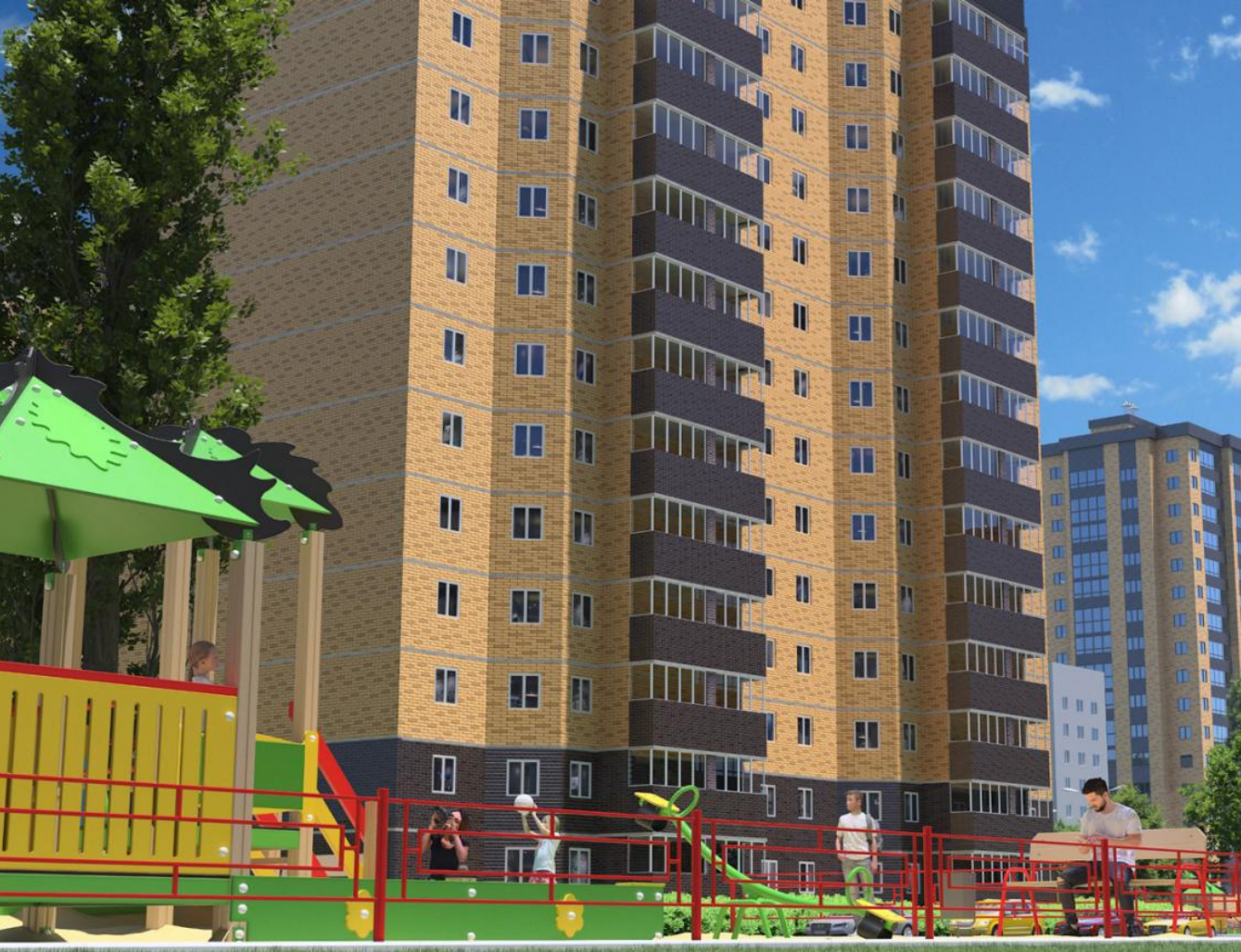
Название ЖК: Кашинцево Класс жилья: Комфорт