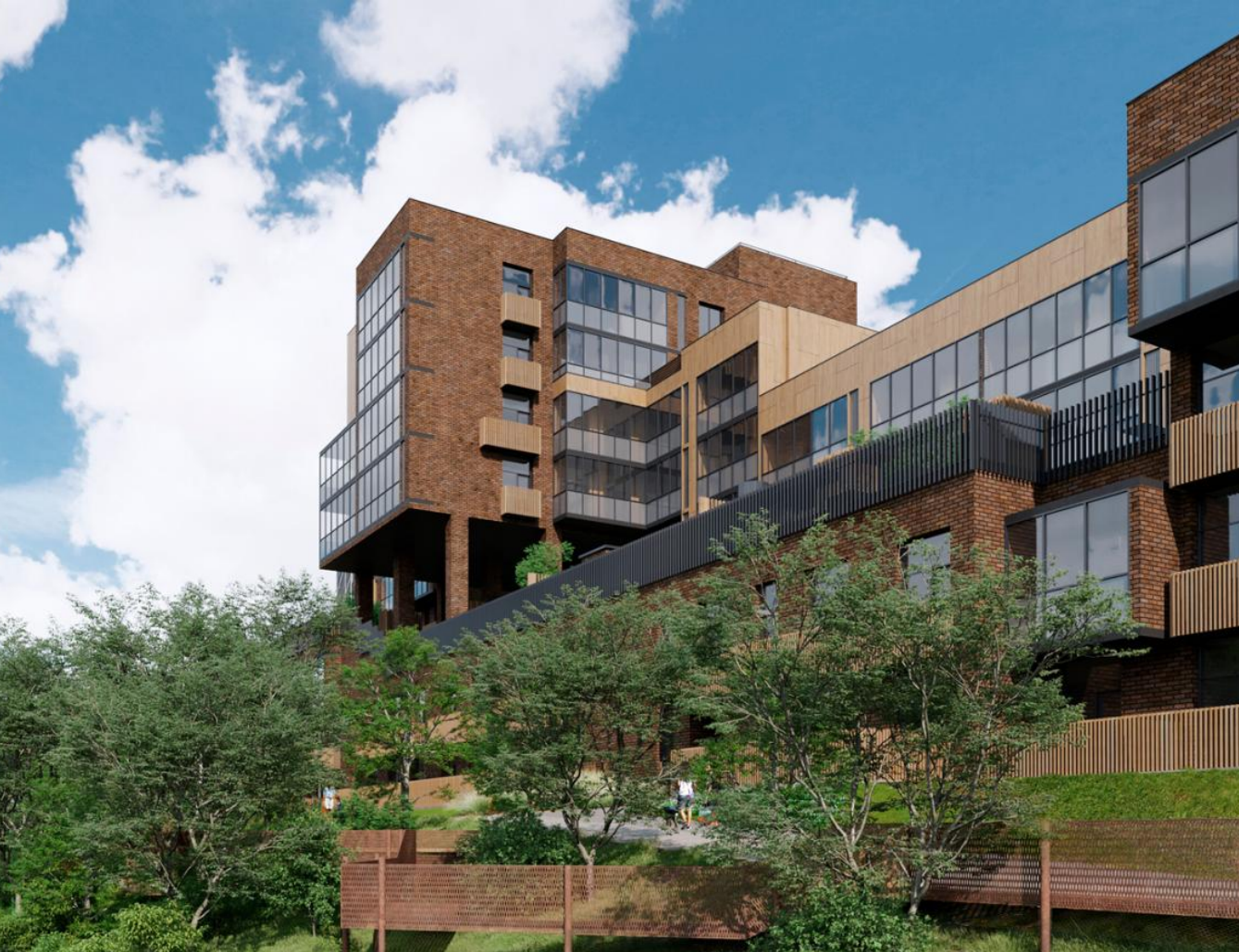
Название ЖК: Отрада на реке Класс жилья: Комфорт