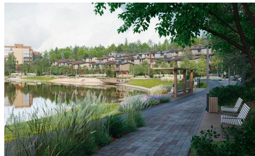
Год постройки: 2027 г.