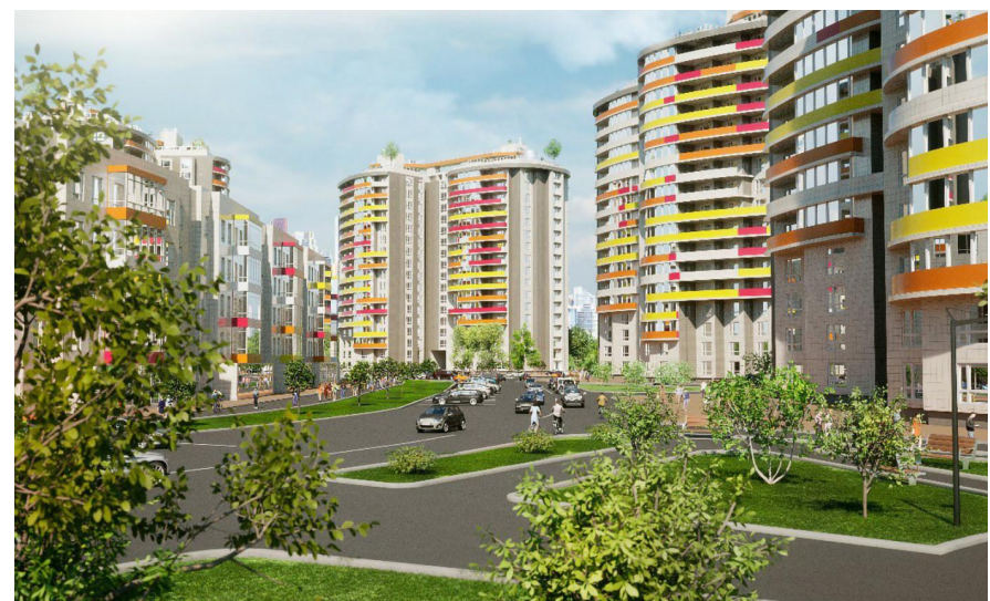
Год постройки: 2025 г.