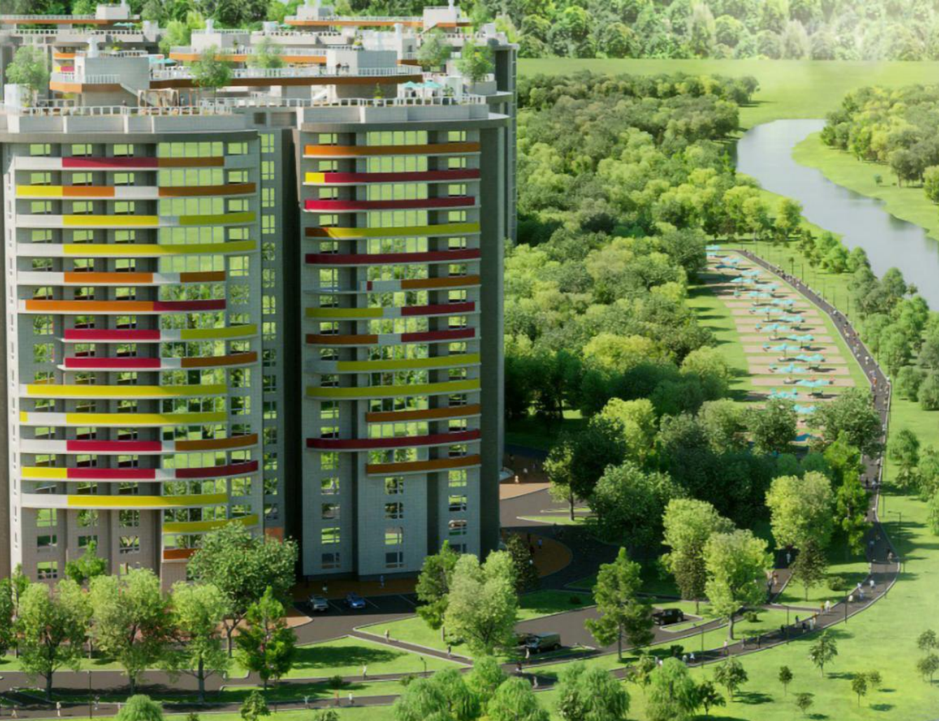
Название ЖК: Соболевка