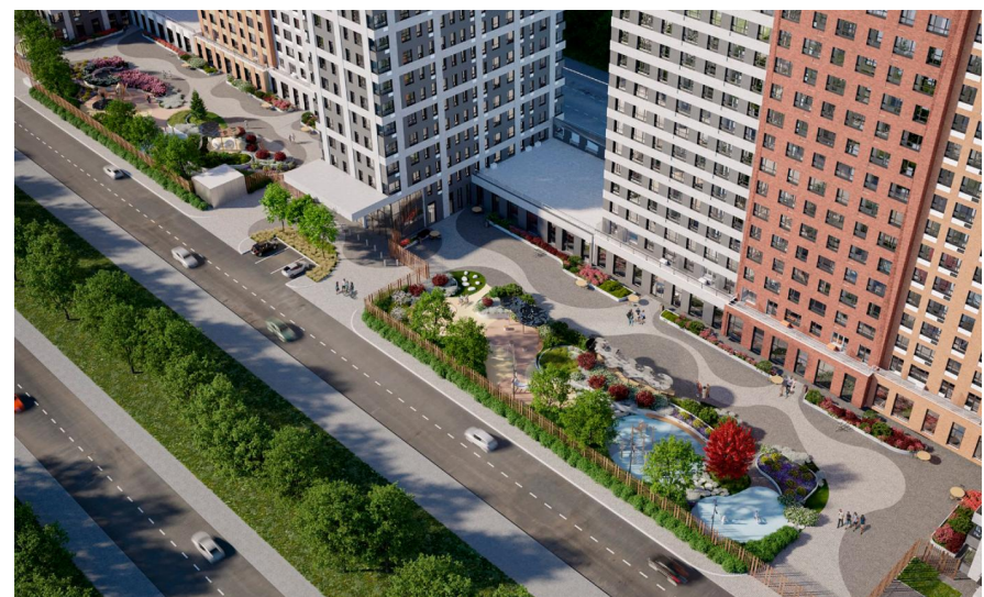
Год постройки: 2027 г.