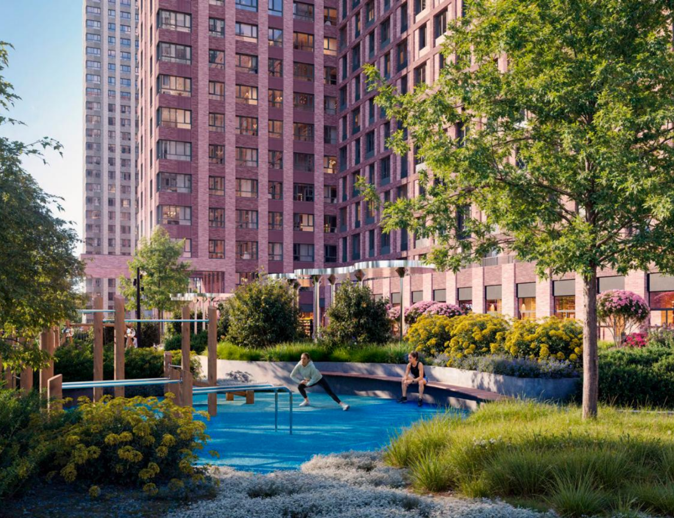
Название ЖК: Аквилон Beside 2.0