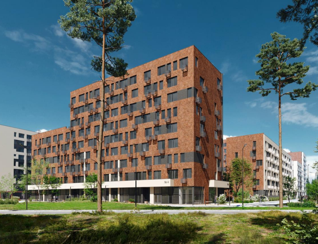
Название ЖК: Никольский квартал Отрада Класс жилья: Комфорт