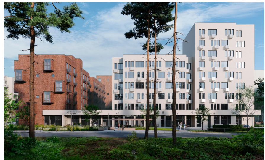
Год постройки: 2026 г.