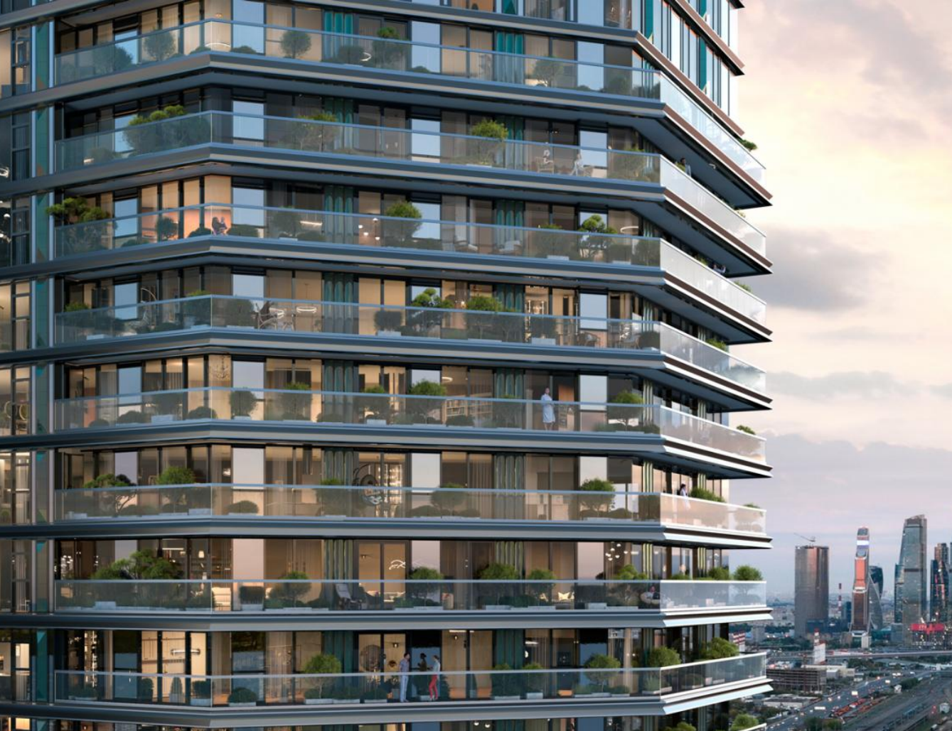
Название ЖК: JOIS