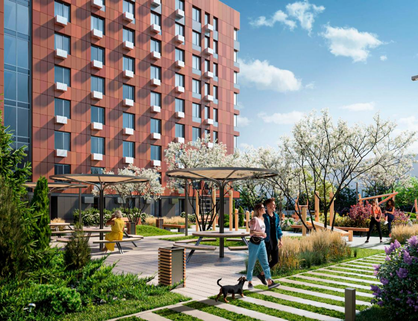
Название ЖК: Citimix Новокосино