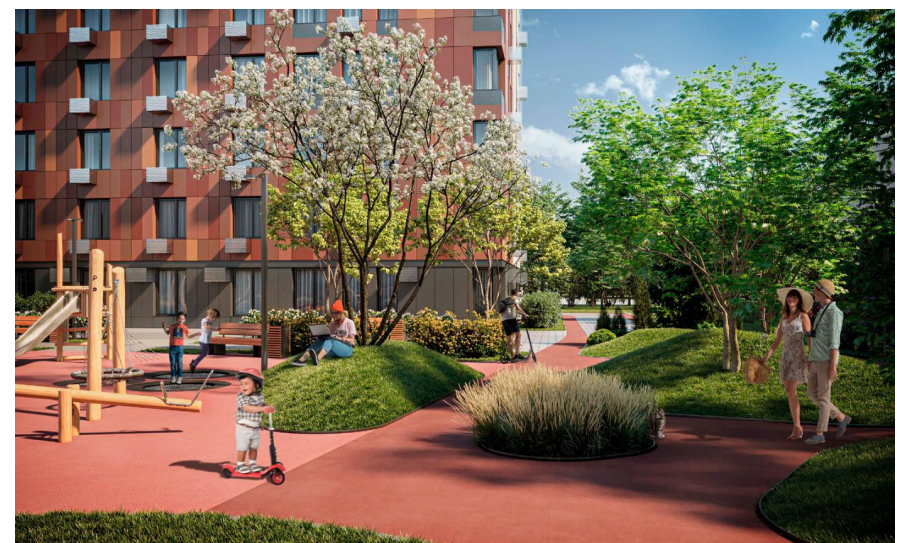
Год постройки: 2025 г.