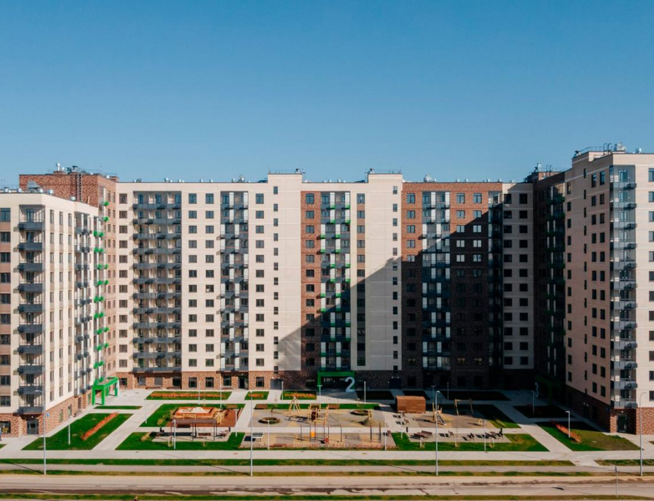
Название ЖК: Алхимово Класс жилья: Комфорт