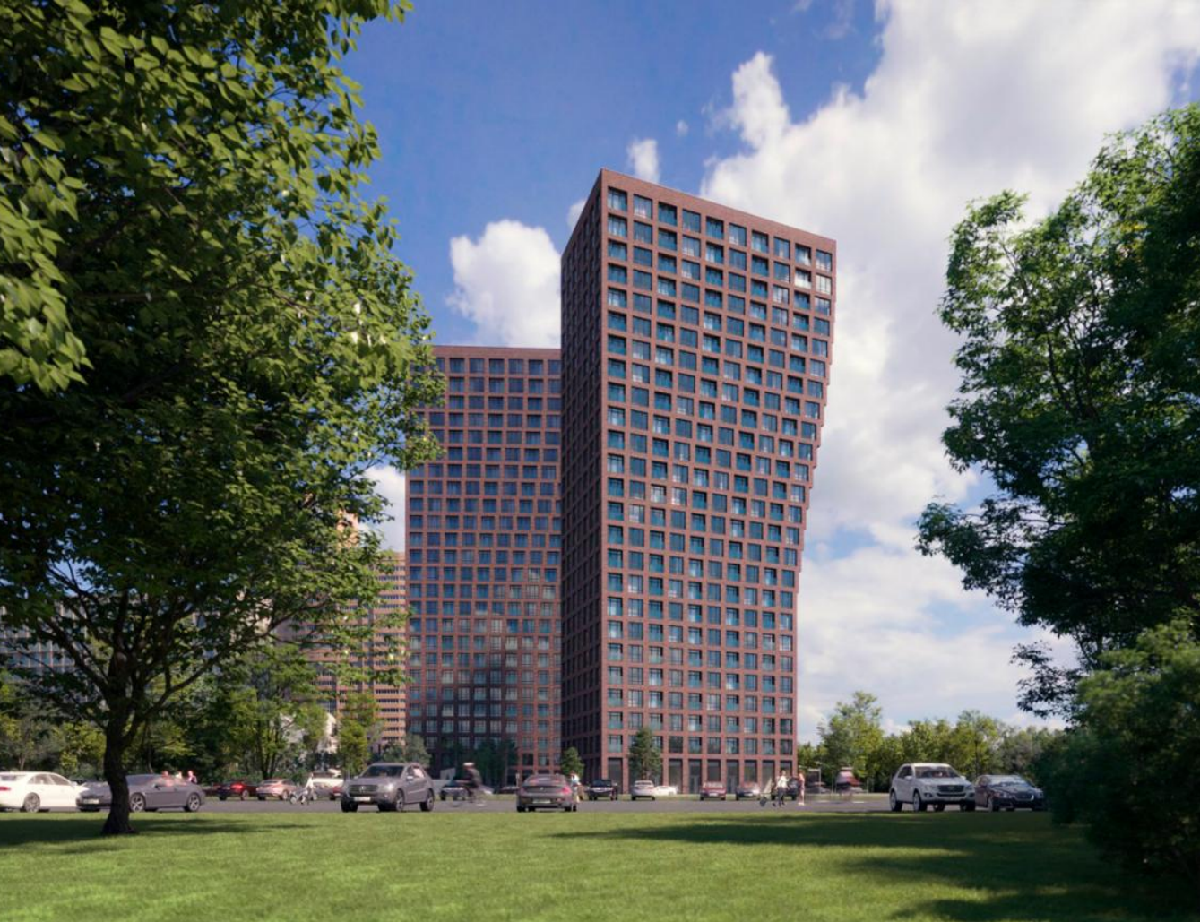
Название ЖК: AFI PARK Воронцовский