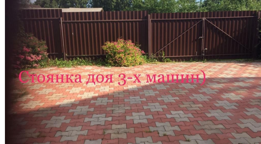
Стоянка для 3-х машин)