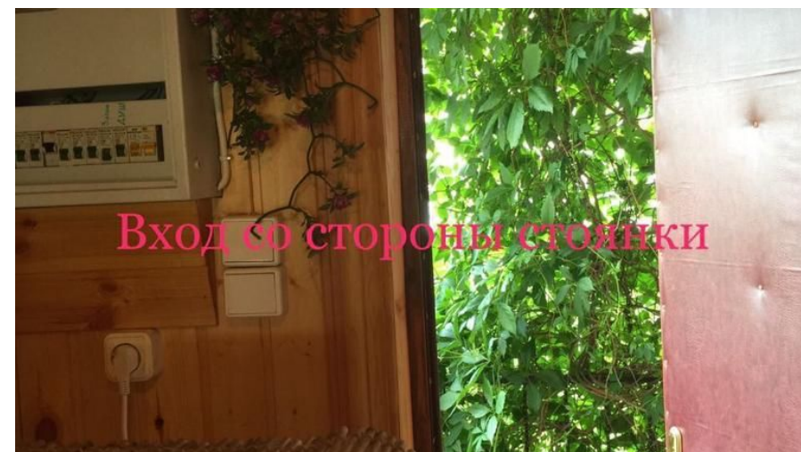
Вход со стороны стоянки