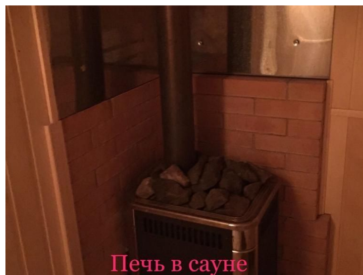
Печь в сауне